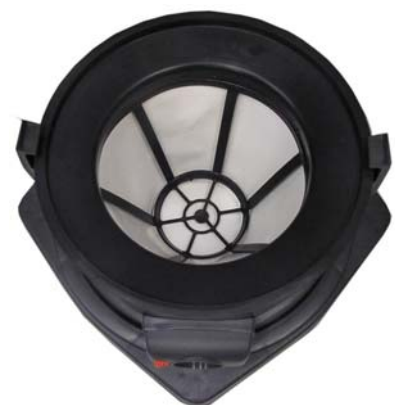
(Filter mit Filterkorb)